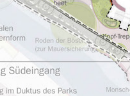
Rasen mit Geophyten und Solitärgehölzen