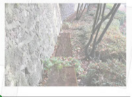
kulissenartige Rabattenpflanzung der 50er-Jahre zwischen bestehender Naturstein-Einfassung und Stadtmauer